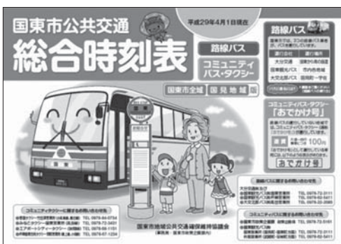
現在配布している総合時刻表

バスもタクシーも運転手不足がネックになっている。有効な方法の問題意識を持って検討しているところです。