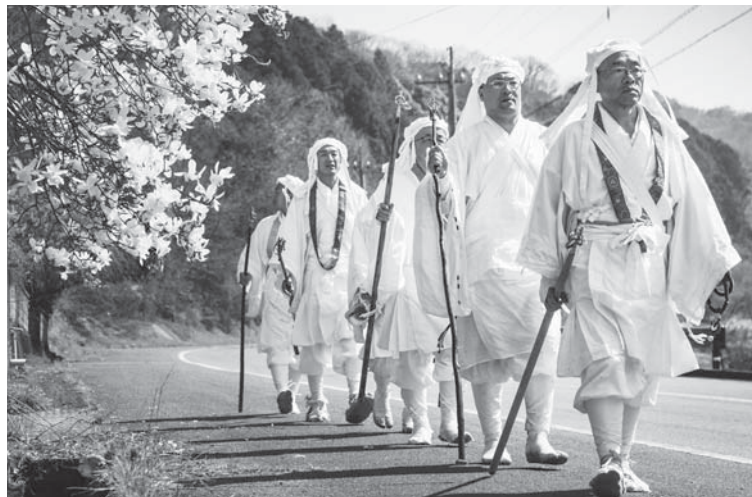
六郷満山峯入りの様子

普及啓発事業、国内外を対象としたマーケティング調査を行いたいと考えています。調査研究事業、案内版や説明版などを設置する公開活用整備事業ということで取り組んでいきたいと思っています。