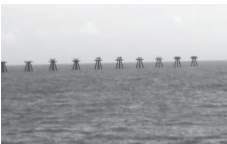
工事中の大分空港進入灯