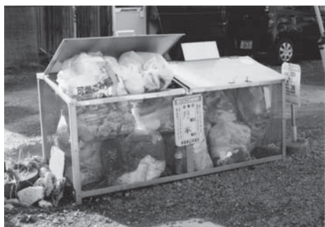
可燃ごみでいっぱいのごみ集積所

集積所の力所数は市内で約1060カ所、1集積所あたり概ね15世帯を基準としています。