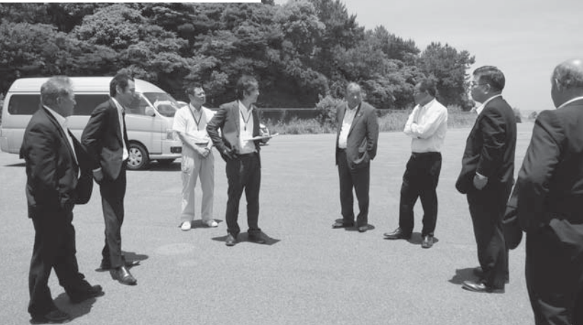
担当職員から説明を受ける産業建設委員(平床漁港)