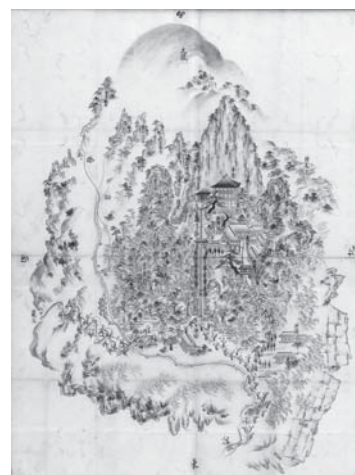
峨眉山文殊仙寺境内図

必要なものがあれば検討はしますが現時点では、優先順位が下がるかなと思っています。