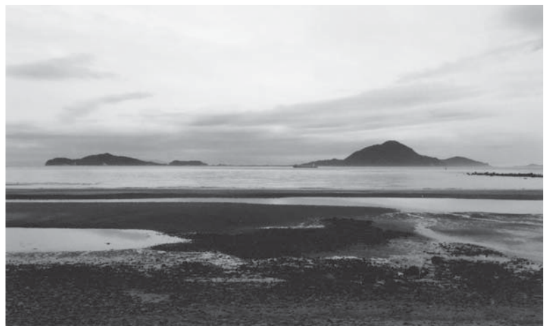
長瀬地区沿岸道路より姫島を望む

次に国道・市道の沿線、特にトンネル入り口上部の樹木が伸びすぎて、土砂崩れを引き起こす恐れがある。