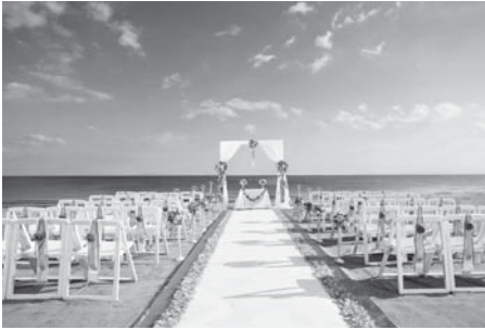
いこいの村ビーチウエディング会場

法要、慶事等については、地元を中心としたきめ細やかな戸別訪問営業。忘新年会等については、ダイレクトメール等を活用して計画的な営業活動を実施します。