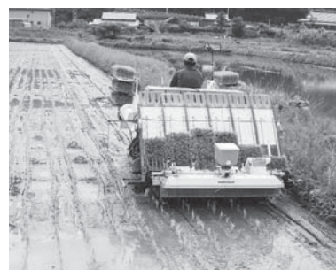
農業公社の農作業の様子

農地が狭く大型の機械では対応できない。また、農地が点在し機械の運搬時間がかなり効率的でないため、全ての作業を受けるとは困難な状況にあります。